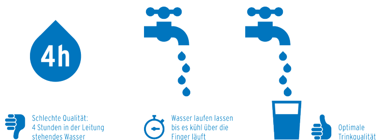
Abb. 2.12-1: Für Lebensmittelzwecke besitzt nach Auskunft des Umweltbundesamtes nur ein Trinkwasser, das nicht länger als 4 Stunden in der Leitung gestanden hat, die optimale Qualität.

TwgS entstammen den unterschiedlichsten, z.T. auch noch nicht identifizierten (»unbekannten«) Herkunftsbereichen. Falls überhaupt detektiert, betragen ihre Messwerte in Trinkwässern noch meist wenige ng/l